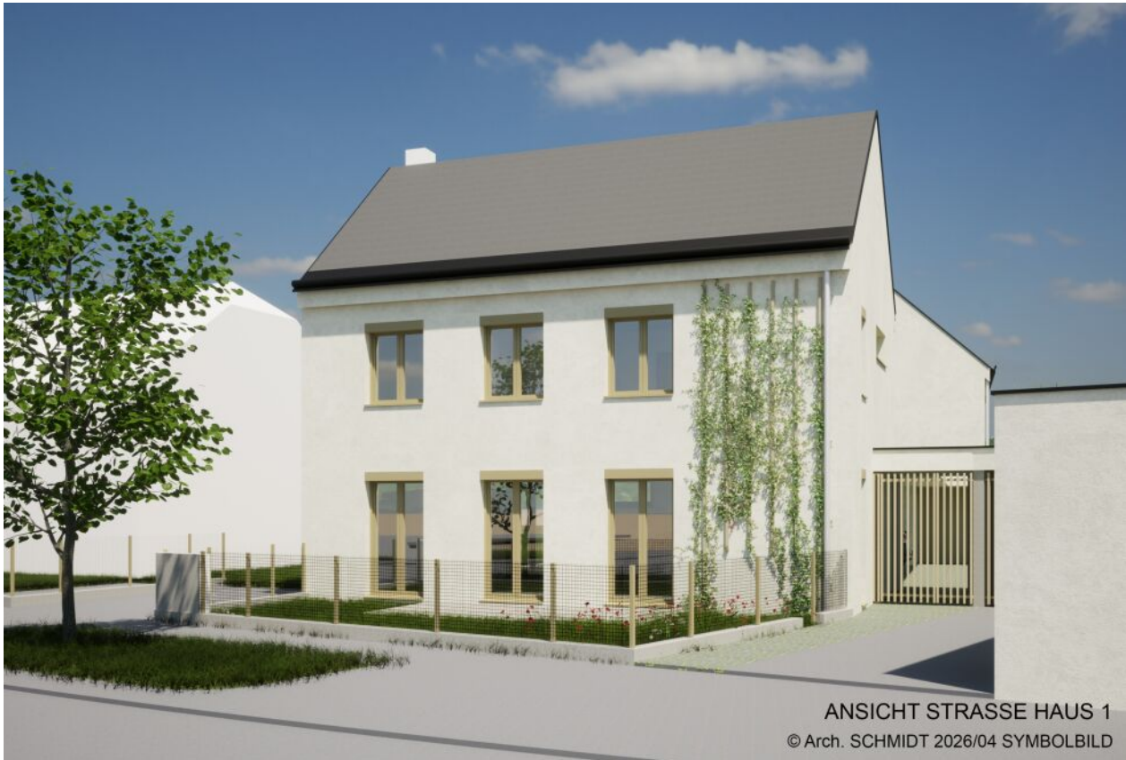
ANSICHT STRASSE HAUS 1